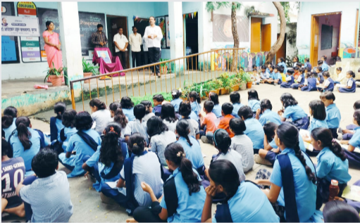
आरंभ मराठी । मुरुम

मुरुम येथील डॉ.आंबेडकर वाचनालयाच्या वतीने जि.प. स्पेशल शाळेत वाचन प्रेरणा दिन साजरा