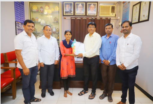
आरंभ मराठी । उमरगा