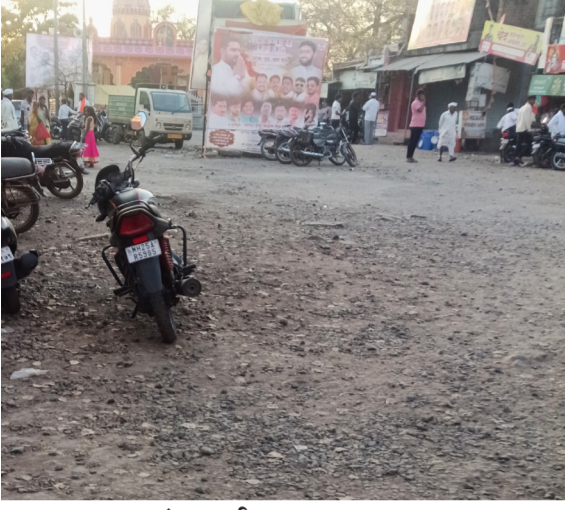
आरंभ मराठी । भूम

१० एप्रिलपासून आकाशात सूर्य आग ओकत असून नागरिकांना उन्हाच्या तीव्र चटक्याचा सामना करावा लागत आहे. उन्हाच्या झळांनी शहरासह ग्रामीण भागातील दैनंदिन जीवनावर मोठा परिणाम झाला आहे. तापमानाचा पारा ४९ अंशावर पोहोचल्याने उष्णतेची तीव्रता अधिकच वाढली आहे. भूम तालुक्यात सर्वाधिक उन्हाची तीव्रता भूम शहरात जाणवत आहे. खडकाळ जमिनीवर वाढलेली वस्ती, दिवसभर तापणारे खडक आणि त्यातून रात्री बाहेर पडणारी उष्णता यामुळे नागरिकांना मोठा त्रास सहन करावा लागत आहे. तालुक्याचे मुख्य ठिकाण असल्याने ग्रामीण भागातील नागरिकांना शासकीय कामांसाठी शहरात यावे लागते; मात्र बहुतांश नागरिक सकाळी ११ वाजेपर्यंत कामे आटोपून गावाकडे परतताना दिसत आहेत. भूम शहरात सकाळी ११ ते सायंकाळी पाच या वेळेत रस्ते ओस पडलेले दिसतात. रस्त्यावर नागरिकांची वर्दळ तसेच वाहनांची वाहतूक कमी झाली आहे. बाजारपेठेत दुकाने उघडी असली तरी ग्राहक