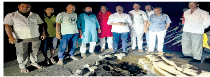
आरंभ मराठी । उमरगा