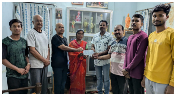
आरंभ मराठी । धाराशिव

सामाजिक कार्यांचा आलेख उंचावला, धाराशिवकरांकडून कौतुक