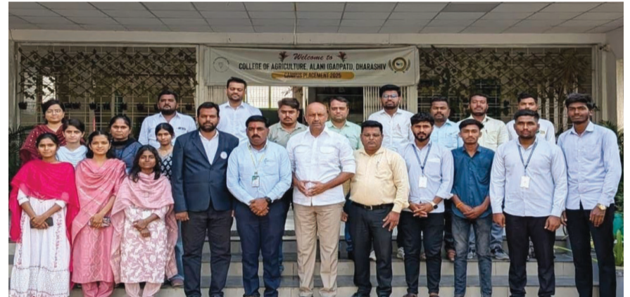
आरंभ मराठी । धाराशिव

व्ही.पी. एज्युकेशनल कॅम्पस, छत्रपती संभाजीनगर रोड, धाराशिव येथील कृषि महाविद्यालयात दिनांक १७ एप्रिल रोजी Ideal Agri Search Pvt. Ltd. या नामांकित कंपनीचा कॅम्पस इंटरव्यू कार्यक्रम यशस्वीरीत्या पार पडला. या निवड प्रक्रियेत अंतिम वर्षातील ३० विद्यार्थ्यांनी सहभाग घेतला होता, त्यापैकी १३ विद्यार्थ्यांची अंतिम निवड करण्यात आली. ही कंपनी पिकांच्या आरोग्यवृद्धीसाठी जैविक खते, सूक्ष्मअन्नद्रव्ये, वनस्पती वाढ नियंत्रक तसेच पाण्यात विद्रव्य खते यांसारख्या विविध कृषी निविष्टा उपलब्ध करून देणारी