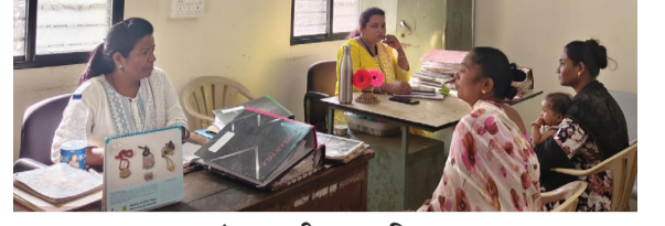
आरंभ मराठी । धाराशिव

इशारा महिलांनी दिला आहे. पळसपमधील पाणीटंचाई ही केवळ काही भागापुरती मर्यादित नसून, अपवाद वाळता संपूर्ण गावाला याचा फटका बसत आहे. त्यामुळे हा प्रश्न कायमस्वरूपी सोडवण्यासाठी प्रशासनाने तातडीने ठोस उपाययोजना कराव्यात, अशी मागणी नागरिकांकडून जोर धरत आहे.