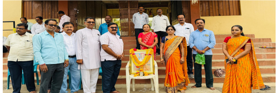
आरंभ मराठी । उमरगा