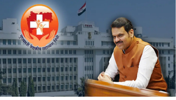
आरंभ मराठी । धाराशिव

मुख्यमंत्री देवेंद्र फडणवीस यांच्या प्रयत्नातून आरोग्यसेवेला गती