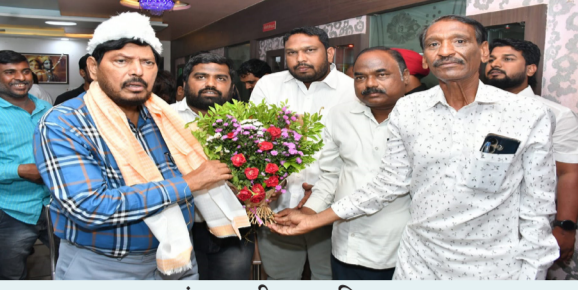
आरंभ मराठी । धाराशिव