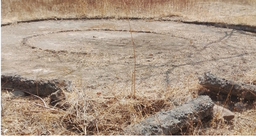
आरंभ मराठी । येरमाळा

येरमाळा येथील श्री येडेश्वरी मंदिर परिसरालगत असलेल्या सुमारे साडेसहाशे एकर वनक्षेत्रात वनविभागाच्या हलगर्जीपणामुळे गंभीर परिस्थिती निर्माण झाली आहे. या परिसरात मोर, हरिण, काळवीट, वानर यांसह विविध वन्यप्राण्यांचे वास्तव्य असून सध्या पाण्याअभावी त्यांच्या अस्तित्वावरच संकट ओढवले आहे. वनविभागाच्या दुर्लक्षामुळे वनसंपत्ती आणि वन्यजीव दोन्ही धोक्यात आले असल्याचे वास्तव समोर येत आहे.