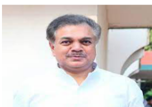
लांबवण्याचा प्रयत्न केला. उच्च न्यायालयात जमा असलेल्या ७५ कोटी रुपयांवर आक्षेप घेत गोंधळ निर्माण करण्याचा प्रयत्न झाला.

धाराशिव: - खरीप २०२० मधील सोयाबीन पीक विम्याच्या प्रश्नावरून गेल्या चार वर्षांपासून सुरू असलेली लढाई आता अंतिम टप्प्यात पोहोचली आहे. सर्वोच्च न्यायालय यांनी या प्रकरणात पुढील तारखेला 'अंतिम सुनावणी' घेण्याचे स्पष्ट आदेश दिले असून, त्यामुळे विमा कंपनीची चालढकल थांबण्याची शक्यता आहे. बुधवारी झालेल्या सुनावणीत विमा कंपनीने पुन्हा तांत्रिक मुद्द्यांचा आधार घेत खटला