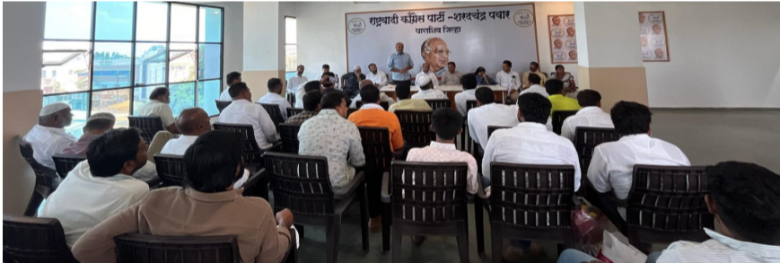
आरंभ मराठी । धाराशिव