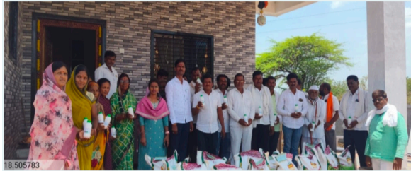
आरंभ मराठी । शिराढोण